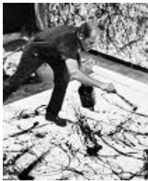
Jackson Pollock (1912-1956) Dripping, occupation maximale de l'espace.