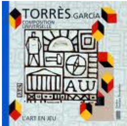
Album disponible à l'inspection

Les enfants travailleront sur des supports de format identique de manière à pouvoir les assembler sous forme de livre.