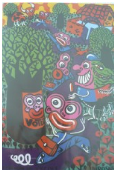
« Le chemin de l'école », 1990 / Hervé Di Rosa (1959-) accumulation d'images, couleurs vives