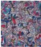
« La houle du virtuel », 1963 / Jean Dubuffet (1901-1985) saturation de la surface