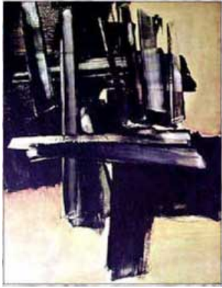
Hans Hartung (1904-1989) geste fort rapide, la trace occupe l'espace