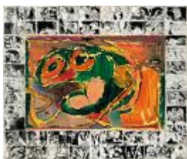
« Central Park », 1965 / Pierre Alechinsky (1927-) cadre, frottage, empreinte