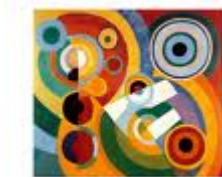
« Rythme et joie de vivre », 1930 / Robert Delaunay forme géométrique, rythme (« Pouvez – vous trouver dans la classe des petits objets qui peuvent laisser une empreinte de cette forme ? )